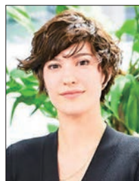
ローレン・ローズ・コーカー